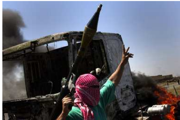
Irakische Guerilla zerstört einen US-Konvoi: Nur acht Prozent aller Anschläge richten sich auf zivile Ziele (Abu Ghraib 2004)

Es gibt keinen Grund, die irakische Bewegung zu idealisieren, genauso wenig aber auch, sich pauschal von ihr zu distanzieren. Schließlich waren es die immer effektiveren Angriffe des „Al Muqawama“, des „nationalen Widerstandes“, 4 die innerhalb von vier Jahren die mächtigste Armee der